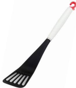
DI-52 ナイロンフライがえし(小)

■材質 / 本体: ステンレス ■寸法 / 約 300×45×22mm / 60g