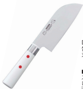
DI-54 包丁(小)カバー付 刃渡り: 11.5cm

■材質 / 刀身: ステンレス刃物鋼、口金: ステンレス、柄部: ABS樹脂 ■寸法 / 約 233×40×18mm / 77g