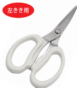
DI-60 キッチンばさみ(左きき用)カバー付

■材質 / ポリプロピレン ■寸法 / 約 430×270×0.7mm / 75g