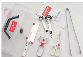
DIG-105 スターター 5点セット