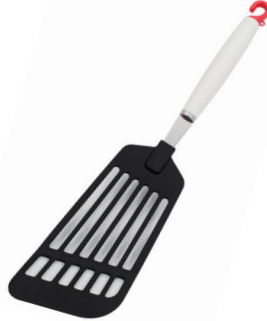
DI-04 ナイロンフライがえし

■材質 / お玉・口金: ステンレス、柄部: ABS樹脂 ■寸法 / 約 275×73×60mm / 80g ■容量 / 45cc