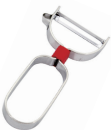
DI-57 ピーラーカバー付

■材質 / 刃部: ステンレス刃物鋼、柄部: ABS樹脂 ■寸法 / 約 160×65×10mm / 56g