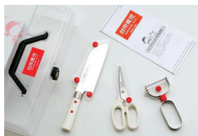
DIG-103 スターター 3点セット

子供に楽しく安全に料理ができるように。また、できた！喜びを家族と共に楽しむうれしさを感じてもらえる「子供用ファミリーキッチンツール」です。