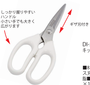
DI-56 キッチンばさみ カバー付

■材質 / 刀身: ステンレス刃物鋼、口金: ステンレス、柄部: ABS樹脂 ■寸法 / 約 233×40×18mm / 77g