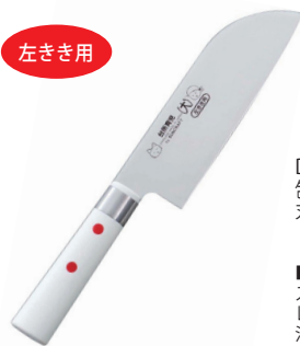
DI-55 包丁(大)(左きき)カバー付 刃渡り: 13cm

■材質 / 刀身: ステンレス刃物鋼、口金: ステンレス、柄部: ABS樹脂 ■寸法 / 約 218×40×18mm / 73g