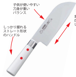
DI-53 包丁(大)カバー付 刃渡り: 13cm

■材質 / 頭部: 66 ナイロン、口金: ステンレス、柄部: ABS樹脂 ■寸法 / 約 297×50×32mm / 50g