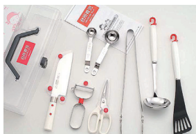
DIG-107 スターター 7点セット