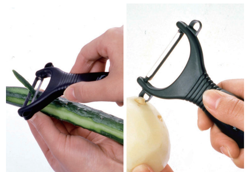
利き手を問わない使い勝手のいい設計です