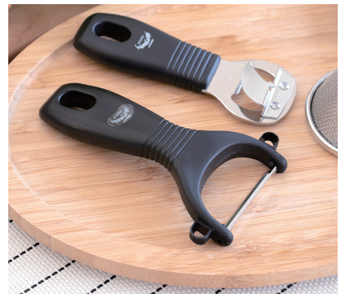
軽い力で皮がむける皮引きは、人気商品です。

手に取りやすいサイズながら、ひとつひとつの機能を十分に考えながら、キッチンに並んだ時の統一感が生まれるように設計されています。全体的に丸みのあるデザインと小ぶりなサイズなので、黒いカラーリングながら優しさとかわいらしさが生まれ、女性にも好評です。