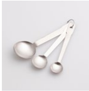
BS-238 計量スプーン 3 本組 3pc of Measuring Spoon Set

■材質 18-8ステンレススチール ■サイズ・重さ 小さじ1/2:約143×28×9mm、約14g、2.5cc 小さじ:約150×33×12mm、約17g、5cc 大さじ:約167×50×17mm、約30g、15cc