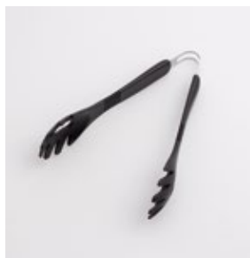
BS-266 スパゲッティトング Spaghetti Tongs

■材質 トング:ナイロン(耐熱温度180℃)、金属部:ステンレススチール ■サイズ(mm) 約194×139×45 ■重さ 約51g