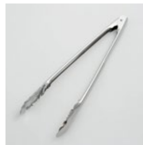
BS-267 ステン料理用トング (大) 31cm Serving Tongs (L)

■材質 本体:ステンレススチール ■サイズ(mm) 約306×93×33 ■重さ 約81g