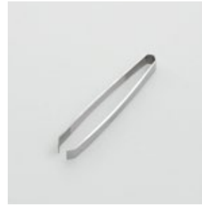
BS-242 骨抜き Bone Remover

■材質 ステンレススチール ■サイズ(mm) 約102×18×15 ■重さ 約28g