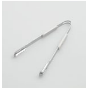
BS-246 アイストング Ice Tongs

■材質 金属部:ステンレススチール、ハンドル:ABS樹脂(耐熱温度60℃) ■サイズ(mm) 約164×88×17 ■重さ 約49g