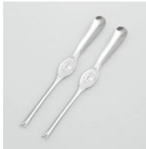
BS-251 かにフォーク 2pc 2pc of Crab Forks

■材質 ステンレススチール ■サイズ(mm) 約200×20×10 ■重さ 約23g