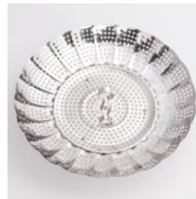
BS-262 フリーサイズ蒸し器 (大) Stainless Steamer (L)

■材質 ステンレススチール ■サイズ(mm) 約175×175×79 (最大サイズ約268×268×79) ■重さ 約230g