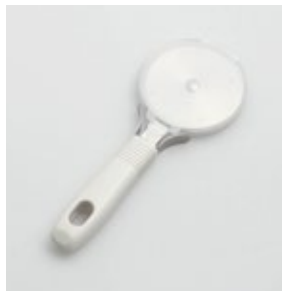
BS-257 ピザカッター (安全カバー付) Pizza Cutter with Safety Cover

■材質 ヘッド・口金:ステンレススチール、ハンドル:ABS樹脂(耐熱温度60℃)、ケース:ポリプロピレン(耐熱温度90℃) ■サイズ(mm) 約193×72×19 (カバー込みサイズ約197×76×19) ■重さ 約83g