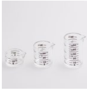
BS-240 計量カップセット 3pc 3pc of Measuring Cup

■材質 メタクリル樹脂(耐熱温度80℃) ■サイズ・重さ 大:約40×46×67mm、約28g 中:約40×46×47mm、約19g 小:約40×46×27mm、約12g