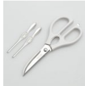
BS-250 かにバサミフォークセット Kitchen Scissors with 2pc of Crab Forks

■材質 刃:ステンレス刃物鋼、ハンドル:ABS樹脂(耐熱温度60℃)、カニフォーク:ステンレススチール ■サイズ・重さ かにバサミ約194×79×11mm、約88g フォーク(1本)約108×11×4mm、約16g