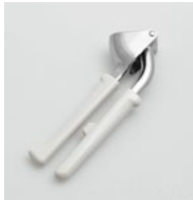
BS-252 にんにく絞り Garlic Press

■材質 ヘッド:アルミダイカスト、ハンドル:ABS樹脂(耐熱温度60℃) ■サイズ(mm) 約159×33×60 ■重さ 約97g