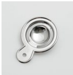
BS-256 卵の黄身分け Egg Separator

■材質 18-8ステンレススチール ■サイズ(mm) 約105×75×15 ■重さ 約21g