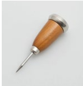
BS-247 アイスピック Ice Pick

■材質 ピック:炭素鋼にクロロムメッキ、口金:ステンレススチール、金属部:鉄鑄物にクロロムメッキ、ハンドル:天然木 ■サイズ(mm) 約128×43×40 ■重さ 約119g