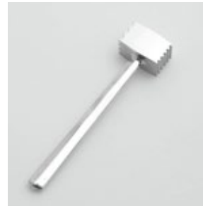
BS-253 肉たたき Meat Tenderizer

■材質 アルミダイカスト ■サイズ(mm) 約205×48×30 ■重さ 約147g