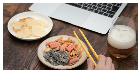
オンライン飲み会・動画鑑賞にも

スマホやパソコン、ゲームをしながら、指先の汚れを気にしないでお菓子が食べられる専用トングです。軽い力で使える設計なので、ポテトチップスなどの薄いスナック菓子を割ることなく、はさんで取ることができます。発売以来、累計販売数は55万個突破。お菓子をたべるだけでなく、海苔や漬物などを取るときや、デコ弁の飾り付けなどにも便利です。