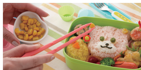
デコ弁などの細かい作業にも