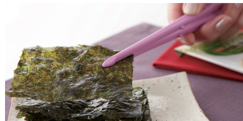
海苔や漬物をつまむのにも