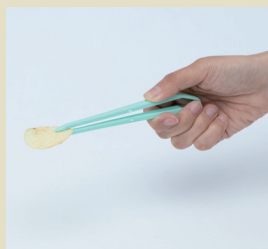
握っても使えます。