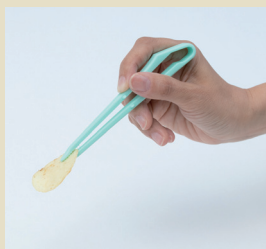
箸のように使えます。