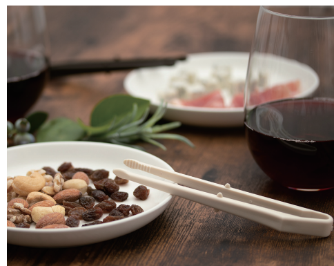
おつまみをつまむのにも便利