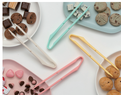
使うのが楽しくなるカラーリング