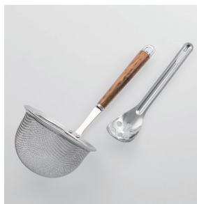
WT-14 みそこしセット Strainer & Masher Set

■材質 網・粹・シャンク・ヘラ:18-8ステンレススチール、口金・フック・尻金:真鍮にクロロムメッキ、ハンドル:天然木にウレタン塗装 ■サイズ(mm) 約265×115×110 ■重さ 約126g