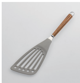
WT-11 ナイロンバタービーター Nylon Beater

■材質 ヘッド:ナイロン(耐熱温度180℃)、シャンク:18-8ステンレススチール、口金・フック・尻金:真鍮にクロロムメッキ、ハンドル:天然木にウレタン塗装 ■サイズ(mm) 約310×80×18 ■重さ 約69g