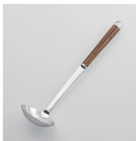
WT-02 お玉 (小) Ladle (S)

■材質 ヘッド:18-8ステンレススチール、口金・フック・尻金:真鍮にクロロムメッキ、ハンドル:天然木にウレタン塗装 ■サイズ(mm) 約285×70×63 ■重さ 約84g ■容量 40cc