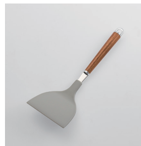
WT-12 ナイロン起し返し Nylon Small Turner

■材質 ヘッド:ナイロン(耐熱温度180℃)、シャンク:18-8ステンレススチール、口金・フック・尻金:真鍮にクロロムメッキ、ハンドル:天然木にウレタン塗装 ■サイズ(mm) 約250×90×48 ■重さ 約64g