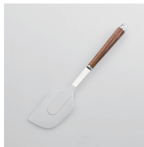
WT-13 ソフトヘラ Silicone Spatula

■材質 ヘッド:シリコーンゴム(耐熱温度220℃)、シャンク:ステンレススチール、口金・フック・尻金:真鍮にクロロムメッキ、ハンドル:天然木にウレタン塗装 ■サイズ(mm) 約280×57×18 ■重さ 約73g