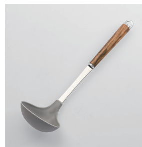
WT-09 ソフトお玉 Nylon Ladle

■材質 ヘッド:ポリプロピレン(フッ素入)(耐熱温度110℃)、シャンク:18-8ステンレススチール、口金・フック・尻金:真鍮にクロロムメッキ、柄部:天然木にウレタン塗装 ■サイズ(mm) 約295×85×63 ■重さ 約65g ■容量 75cc