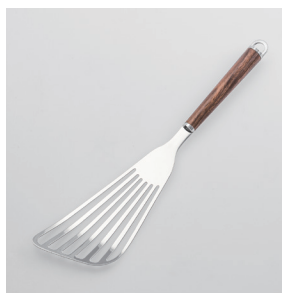
WT-05 バタービーター Beater

■材質 ヘッド:18-8ステンレススチール、口金・フック・尻金:真鍮にクロロムメッキ、ハンドル:天然木にウレタン塗装 ■サイズ(mm) 約315×80×18 ■重さ 約77g