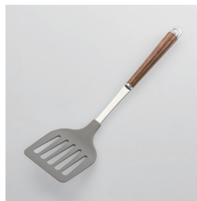
WT-10 ナイロンターナー Nylon Turner

■材質 ヘッド:ナイロン(耐熱温度180℃)、シャンク:18-8ステンレススチール、口金・フック・尻金:真鍮にクロロムメッキ、ハンドル:天然木にウレタン塗装 ■サイズ(mm) 約305×80×45 ■重さ 約65g