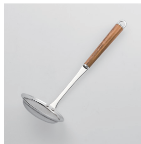
WT-07 あく取り Scum Strainer (Fine Mesh)

■材質 ヘッド:18-8ステンレススチール、口金・フック・尻金:真鍮にクロロムメッキ、ハンドル:天然木にウレタン塗装 ■サイズ(mm) 約280×90×80 ■重さ 約75g