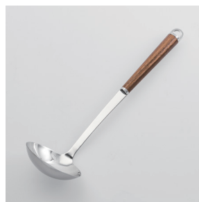
WT-01 お玉 (中) Ladle (M)

■材質 金属部:18-8ステンレススチール、口金・フック・尻金:真鍮にクロロムメッキ、ハンドル:天然木にウレタン塗装 ■サイズ(mm) 約295×80×68 ■重さ 約96g ■容量 70cc