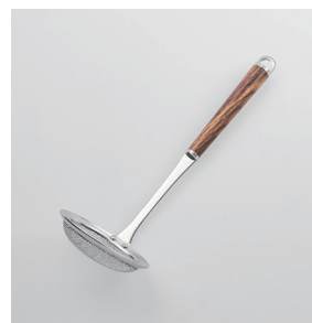
WT-06 かす揚げ Scum Strainer (Regular Mesh)

■材質 ヘッド:18-8ステンレススチール、口金・フック・尻金:真鍮にクロロムメッキ、ハンドル:天然木にウレタン塗装 ■サイズ(mm) 約280×90×80 ■重さ 約82g