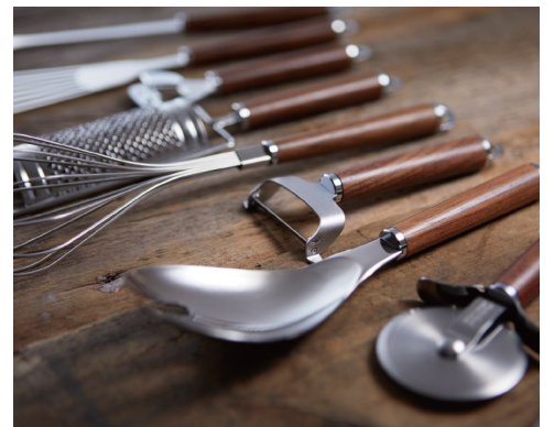
つなぎめのない一体加工で衛生的です。

さらに基本のツールに加え、サービングウエアも充実。ダイニングなどの食卓シーンを美しく演出します。