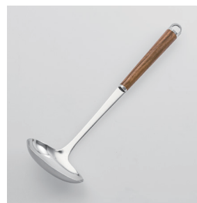
WT-03 横レードル Gravy Ladle

■材質 ヘッド:18-8ステンレススチール、口金・フック・尻金:真鍮にクロロムメッキ、ハンドル:天然木にウレタン塗装 ■サイズ(mm) 約290×90×57 ■重さ 約84g ■容量 50cc