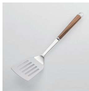
WT-04 ターナー穴あき Slotted Turner

■材質 ヘッド:18-8ステンレススチール、口金・フック・尻金:真鍮にクロロムメッキ、ハンドル:天然木にウレタン塗装 ■サイズ(mm) 約310×70×45 ■重さ 約82g