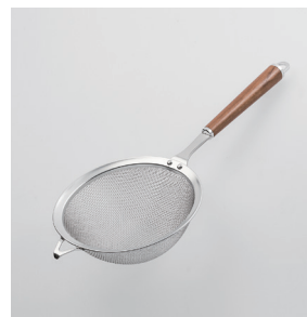
WT-15 万能こし Strainer

■材質 ヘッド:18-8ステンレススチール、口金・フック・尻金:真鍮にクロロムメッキ、ハンドル:天然木にウレタン塗装 ■サイズ(mm) 約325×140×60 ■重さ 約110g