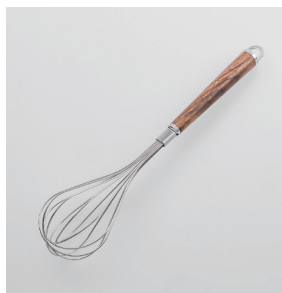
WT-08 泡立て Whisk

■材質 ヘッド:ステンレススチール、口金・フック・尻金:真鍮にクロロムメッキ、ハンドル:天然木にウレタン塗装 ■サイズ(mm) 約290×70×70 ■重さ 約57g