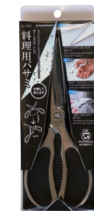
パッケージイメージ写真