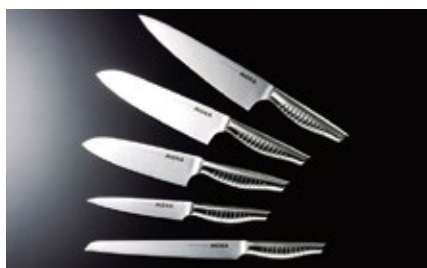
2007 年 オールステンレス包丁「MOKA」開始(グッドデザイン賞受賞)