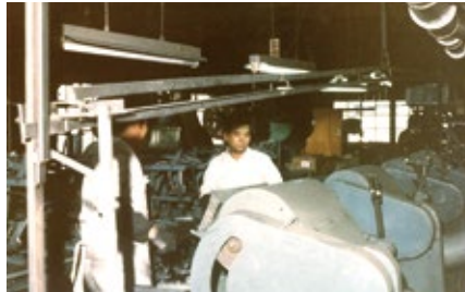
1964 年 包丁・貿易用キッチンナイフの製造開始