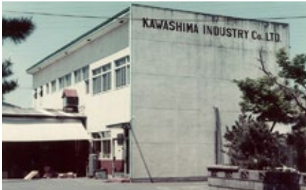
1963 年「川嶋工業株式会社」に社名変更