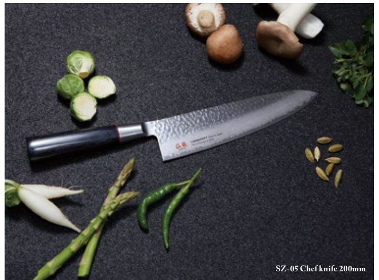
SZ-05 Chef knife 200mm