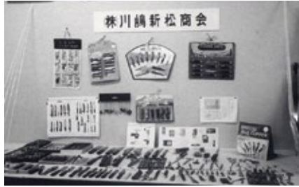
1959 年 株式会社川嶋新松商会 設立