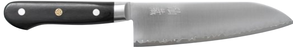
MP-03 SANTOKU KNIFE 165MM ■ Sugg. price USD250 JAN code : 4971884226519