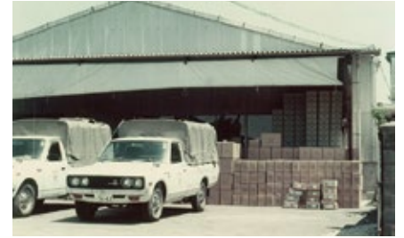
1960 年 米国向け貿易開始