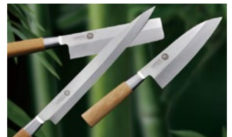
2007 年 海外包丁「MU 無」発表 (デザイナー・パオラ)