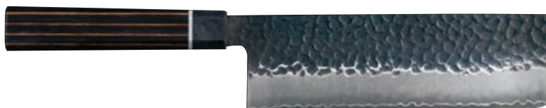
ZB-06 Nakiri knife 170mm

■ Sugg. price USD380 JAN code : 4971884164514