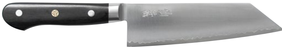
MP-05 BUNKA KNIFE 165MM ■ Sugg. price USD250 JAN code : 4971884226717