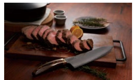
2018 年 男性専用包丁「ELEGANCIA」発表