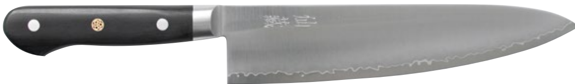
MP-04 CHEF KNIFE 210MM ■ Sugg. price USD290 JAN code : 4971884226618