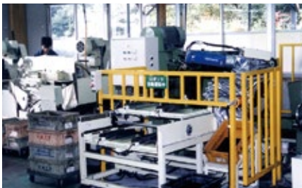
1980 年 キッチンツール「メリアンティ」発表