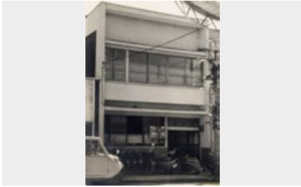
1948 年 川嶋新松商会として創業。刃物類の卸販売開始