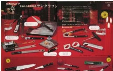
1966 年 ナイフ・ガジェット類「SUNCRAFT (サンクラフト)」発表 1969 年「SUNCRAFT (サンクラフト)」グッドデザイン賞取得