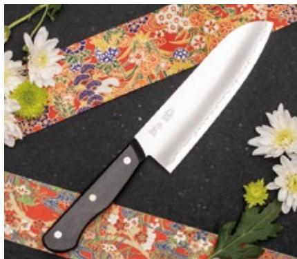
EN-02 Santoku knife 167mm