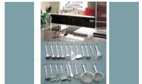
1992 年 キッチンツール「シェフェリエ」グッドデザイン賞受賞