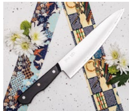
EN-03 Chef knife 200mm