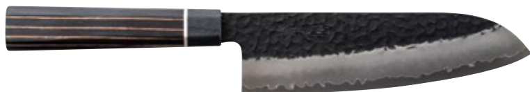
ZB-03 Santoku Knife 170mm

■ Sugg. price USD260 JAN code : 4971884164217