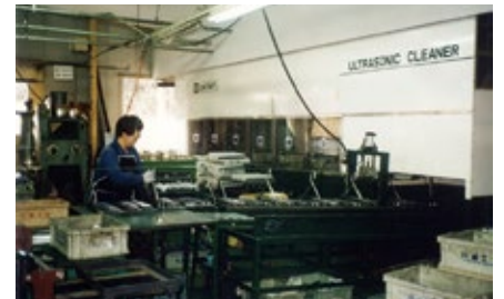
1978 年 関市池尻 1924 に移転。さらなる設備投資を行った