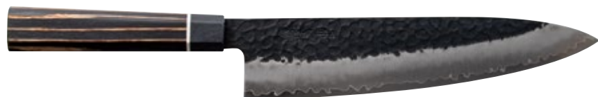
ZB-04 Chef Knife 210mm

■ Sugg. price USD380 JAN code : 4971884164316