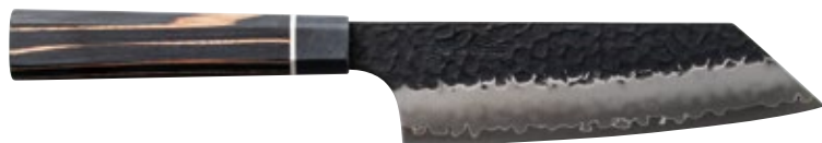
ZB-05 Bunka Knife 165mm

■ Sugg. price USD400 JAN code : 4971884164415