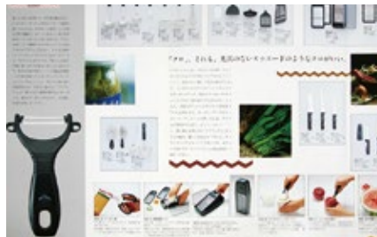
1980 年 キッチンツール「メリアンティ」発表