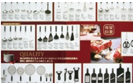
1994 年 キッチンツール「愛妻専科」「台所育児」発表