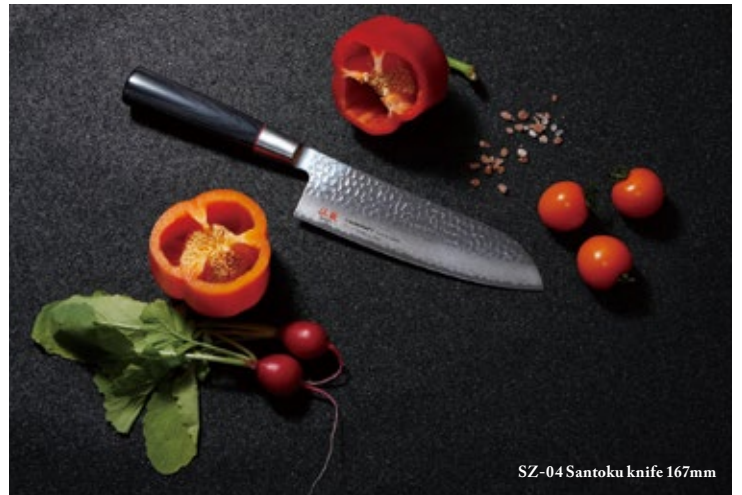
SZ-04 Santoku knife 167mm

Material/ Blade: VG10 Damascus steel (33 layers) • Handle: Black pakkawood • Bolster: Stainless steel with red fiber ring. Packaging/ Individual paper gift box (6pcs in inner box)