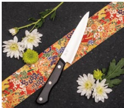
EN-01 Petty knife 120mm

初めて日本製の包丁をお使い頂く方向けに、お求めやすい価格帯でかつ高品質な包丁シリーズになっています。3層鋼のブレードは刃先の薄さを追求し、日本製包丁独特の切れの良さを実感いただけるでしょう。