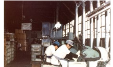
1964 年 包丁・貿易用キッチンナイフの製造開始