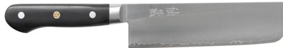
MP-06 NAKIRI KNIFE 165MM ■ Sugg. price USD250 JAN code : 4971884226414