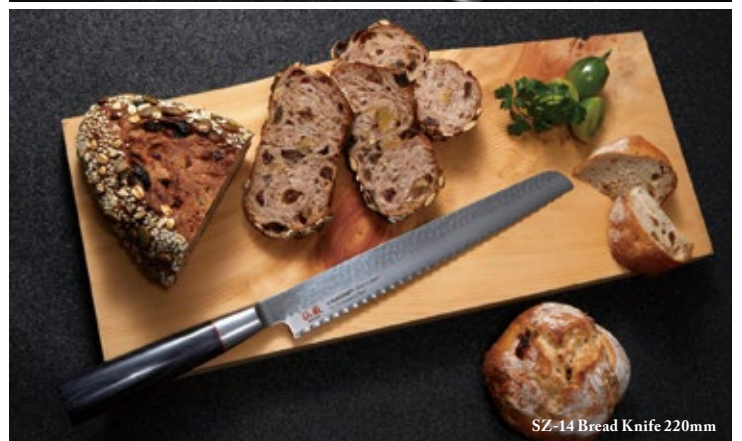
SZ-14 Bread Knife 220mm