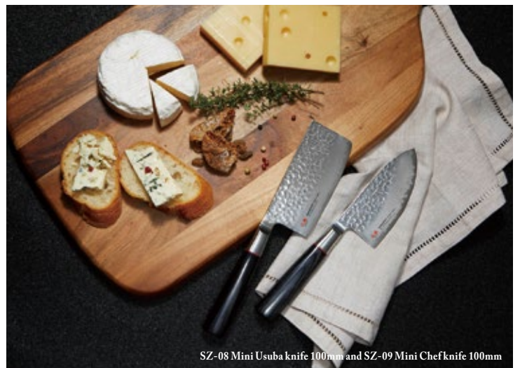
SZ-08 Mini Usuba knife 100mm and SZ-09 Mini Chef knife 100mm