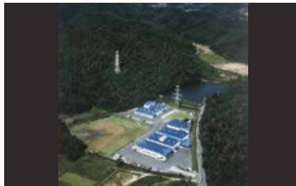
1978 年 関市池尻 1924 に移転