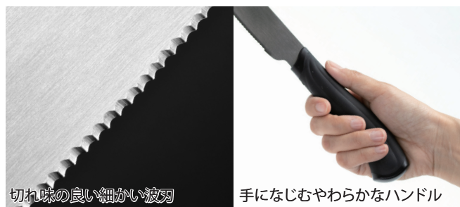
切れ味の良い細かい波刃