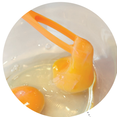
このリング部分で卵を混ぜる

TS-01たまごのなめらかスティック(イエロー) TS-02たまごのなめらかスティック(オレンジ)