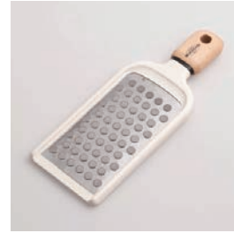
BM-218 おろし器 Grater

■材質 刃:ステンレス刃物鋼、 ハンドル:天然木にウ レタン塗装、本体:ABS 樹脂(耐熱温度60℃) ■サイズ(mm) 約231×88×21 ■重さ 約99g