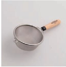
BM-217 茶こし Tea Strainer

■材質 ヘッド:18-8ステン レススチール、ハンド ル:天然木にウレタン 塗装、リング:ABS樹脂 (耐熱温度60℃) ■サイズ(mm) 約158×76×41 ■重さ 約29g