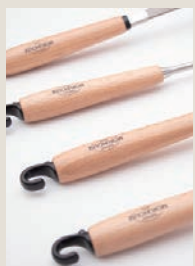
天然木のハンドルなので色調や木目の違いがあります