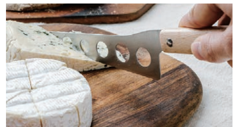
テーブルでも使いやすいチーズナイフ