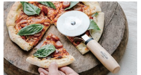
切れ味のいいピザカッター

天然木の温かみと、日本国内で作られる高品質なステンレスパーツ、アクセントとなる黒でスタイリングされたキッチンシリーズです。そこにあるだけで、お洒落なカフェの様なキッチンが叶います。丸みのある天然木のハンドルと、ツールヘッドをつなぐ細いステンレスのシャンク（軸）のコントラストも人気のひとつです。テーブルでも使いやすいチーズナイフや専用の収納ケースが付いたピザカッター、ちょっと本格派なチーズおろしなどが揃っています。