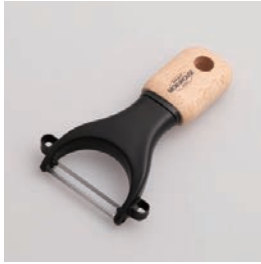
BM-216 ピーラー Peeler

■材質 刃:ステンレス刃物鋼、 ハンドル:天然木にウ レタン塗装、ヘッド:ポ リプロピレン(耐熱温 度70℃)、リング:ABS 樹脂(耐熱温度60℃) ■サイズ(mm) 約126×78×23 ■重さ 約48g