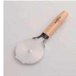
BM-221 ピザカッター (安全カバー付) Pizza Cutter

■材質 ヘッド:ステンレス スチール、ハンドル:天然 木にウレタン塗装、リ ング:ABS樹脂(耐熱温 度60℃)、カバー:ポリ プロピレン(耐熱温度 90℃) ■サイズ(mm) 約191×72×22、カ バー装着時:約196× 76×22 ■重さ 約61g、カバー装着時: 約77g