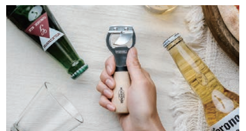
丸いフォルムが人気の栓抜切