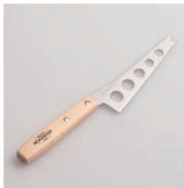
BM-223 チーズナイフ Cheese Knife

■材質 刃:ステンレス刃物鋼、 ハンドル:天然木にウ レタン塗装、鋏:ステン レススチール ■サイズ(mm) 約234×38×16 刃渡り:115 ■重さ 約35g