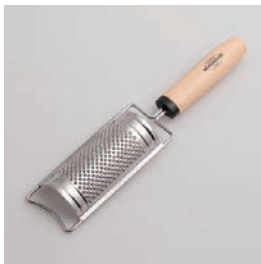
BM-222 チーズおろし Cheese Grater

■材質 ヘッド:ステンレス スチール、ハンドル:天然 木にウレタン塗装、リ ング:ABS樹脂(耐熱温 度60℃) ■サイズ(mm) 約242×54×29 ■重さ 約70g