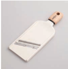
BM-219 千切り器 Shredder

■材質 刃:ステンレス刃物鋼、 ハンドル:天然木にウ レタン塗装、本体:ABS 樹脂(耐熱温度60℃) ■サイズ(mm) 約231×88×21 ■重さ 約93g