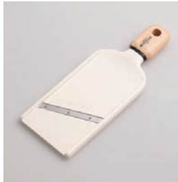
BM-220 スライサー Slicer

■材質 刃:ステンレス刃物鋼、 ハンドル:天然木にウ レタン塗装、本体:ABS 樹脂(耐熱温度60℃) ■サイズ(mm) 約231×88×21 ■重さ 約92g