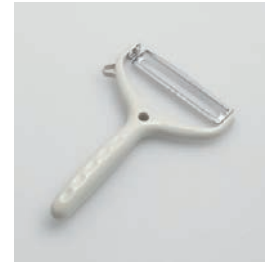
BS-228 両刃ワイドピーラー Wide Peeler

■材質 刃: ステンレス刃物鋼、 本体: ABS樹脂(耐熱温度60℃) ■サイズ(mm) 約162×106×26 ■重さ 約60g