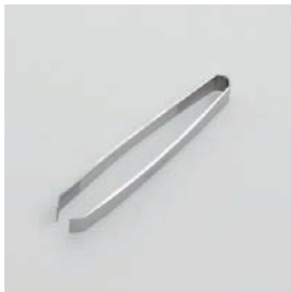
BS-242 骨抜き Bone Remover

■材質 ステンレススチール ■サイズ(mm) 約102×18×15 ■重さ 約28g