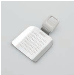
BS-229 ミニおろし Mini-Grater

■材質 刃: ステンレススチール、 本体: ABS樹脂(耐熱温度60℃) ■サイズ(mm) 約115×76×22 ■重さ 約71g