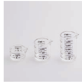
BS-240 計量カップセット 3pc 3pc of Measuring Cup

■材質 本体: メタクリル樹脂 (耐熱温度80℃) ■サイズ(mm) 大: 約40×46×67 中: 約40×46×47 小: 約40×46×27 ■重さ 大: 約28g、中: 約19g、 小: 約12g ■目盛(5ccごと) 大: 50ccまで、中: 30cc まで、小: 15ccまで