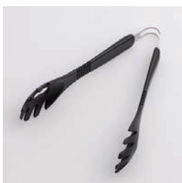
BS-266 スパゲッティ tong Spaghetti Tongs

■材質 トング: ナイロン(耐熱 温度180℃)、金属部: ステンレススチール ■サイズ(mm) 約194×139×45 ■重さ 約51g