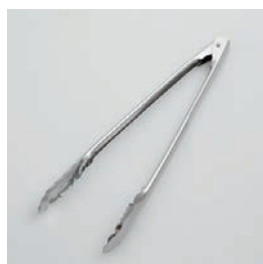
BS-267 ステン料理用 tong (大) 31cm Serving Tongs (L)

■材質 本体: ステンレス スチール ■サイズ(mm) 約306×93×33 ■重さ 約81g