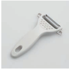
BS-226 きんぴらごぼう引き Shredder

■材質 刃: ステンレス刃物鋼、 本体: ABS樹脂(耐熱温度60℃) ■サイズ(mm) 約145×84×22 ■重さ 約34g ※刃は中国製