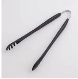
BS-269 ナイロントング Nylon Cooking Tongs

■材質 トング: ナイロン(耐熱温度180℃)、金属部: ステンレススチール ■サイズ(mm) 約245×105×28 ■重さ 約48g