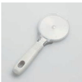
BS-257 ピザカッター (安全カバー付) Pizza Cutter with Safety Cover

■材質 ヘッド・口金: ステン レススチール、ハンドル: ABS樹脂(耐熱温度60℃)、 ケース: ポリプロピレン (耐熱温度90℃) ■サイズ(mm) 約193×72×19、カ バー装着時: 約197× 76×19 ■重さ 約83g