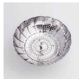
BS-263 フリーサイズ蒸し器 (小) Stainless Steamer (S)

■材質 ステンレススチール ■サイズ(mm) 約140×140×78、最 大サイズ: 約237×237 ×78 ■重さ 約166g