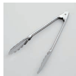
BS-268 ステン料理用 tong (小) 24cm Serving Tongs (S)

■材質 本体: ステンレス スチール ■サイズ(mm) 約233×109×36 ■重さ 約63g