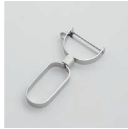
BS-227 ステンレス皮引き Stainless Peeler

■材質 刃: ステンレス刃物鋼、 樹脂部: ABS樹脂(耐熱温度60℃)、本体: 18-8 ステンレススチール ■サイズ(mm) 約124×62×16 ■重さ 約58g