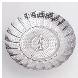
BS-262 フリーサイズ蒸し器 (大) Stainless Steamer (L)

■材質 ステンレススチール ■サイズ(mm) 約175×175×79、最 大サイズ: 約268×268 ×79 ■重さ 約230g