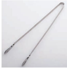
BS-270 さいばしトング Stainless Cooking Tongs

■材質 ステンレススチール ■サイズ(mm) 約299×127×21 ■重さ 約73g