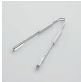
BS-246 アイストング Ice Tongs

■材質 金属部: ステンレス スチール、ハンドル: ABS 樹脂(耐熱温度60℃) ■サイズ(mm) 約164×88×17 ■重さ 約49g