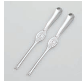
BS-251 かにフォーク 2pc 2pc of Crab Forks

■材質 ステンレススチール ■サイズ(mm) 約200×20×10 ■重さ 約23g