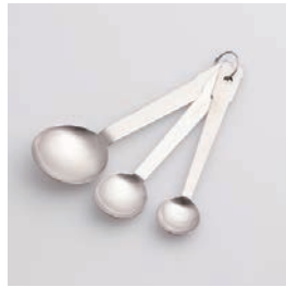
BS-238 計量スプーン 3本組 3pc of Measuring Spoon Set

■材質 本体: 18-8ステン レススチール ■サイズ(mm) 小さじ1/2: 約143×28×9 小さじ: 約150×33×12 大さじ: 約167×50×17 ■重さ 小さじ1/2: 約14g 小さじ: 約17g 大さじ: 約30g ■容量 小さじ1/2: 約2.5cc 小さじ: 約5cc 大さじ: 約15cc