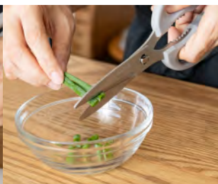
ねぎの小口切りに