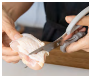
滑りやすい鶏肉の下処理に