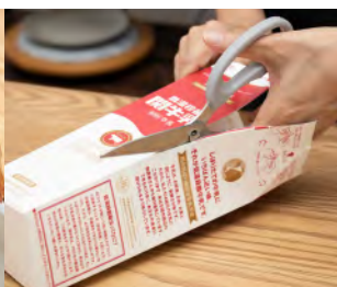
レトルトの開封や牛乳パックの解体に