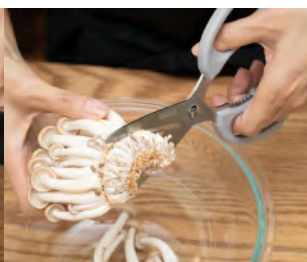
キノコやブロッコリーの下処理に