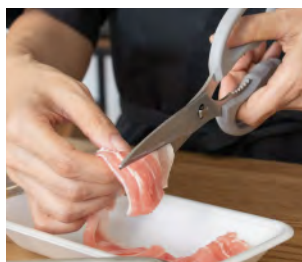
薄切り肉のカットに