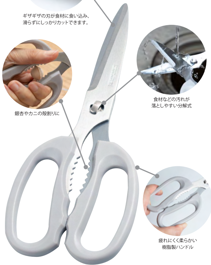
銀杏やカニの殻割りに