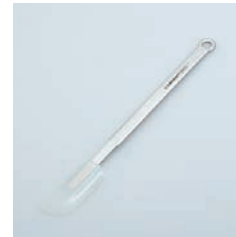
PP-736 シリコンヘラ (S) Silicone Spatula (S)

■材質 ヘッド:シリコン(耐熱温度220℃)、ハンドル:18-8ステンレススチール ■サイズ(mm) 約264×26×8 ■重さ 約59g