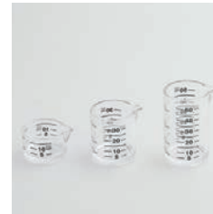
PP-516 計量カップセット 3pc 3 pcs of Acrylic Measuring Cup

■材質 メタクリル樹脂(耐熱温度80℃) ■サイズ(mm) 大:約40×46×67 中:約40×46×47 小:約40×46×27 ■重さ 大:約28g、中:約19g、小:約12g ■目盛(5ccごと) 大:50ccまで、中:30ccまで、小:15ccまで