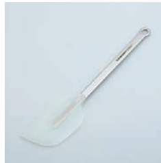
PP-735 シリコンヘラ (L) Silicone Spatula (L)

■材質 ヘッド:シリコン(耐熱温度220℃)、ハンドル:18-8ステンレススチール ■サイズ(mm) 約272×57×10 ■重さ 約77g