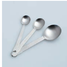
PP-513 計量スプーン (3 本組) 3 pcs of Measuring Spoon

■材質 18-8ステンレススチール ■サイズ(mm) 小さじ1/2:約143×28×9 小さじ:約150×33×12 大さじ:約167×50×17 ■重さ 小さじ1/2:約14g、小さじ:約17g、大さじ:約30g ■容量 小さじ1/2:約2.5cc、小さじ:約5cc、大さじ:約15cc