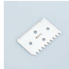
PP-530 デコレーションコーム Stainless Serrated Scraper

■材質 ステンレススチール ■サイズ(mm) 約69×101×1 ■重さ 約23g