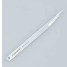
PP-801 ケープナイフ Bread Lame

■材質 ステンレス刃物鋼 ■サイズ(mm) 約8×130×0.5 ■重さ 約3g