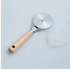
PP-542 ピザカッター (安全ケース付) Pizza Cutter with Safety Cover

■材質 刃:ステンレス刃物鋼、口金:ステンレススチール、ハンドル:天然木にウレタン塗装、ケース:ポリプロピレン(耐熱温度90℃) ■サイズ(mm) 約212×71×24、ケース込み:約216×76×24 ■重さ 約64g、ケース込み:約80g