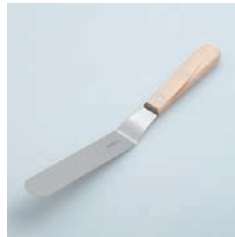
PP-524 パレット曲り (大) Spatula (Bent) L

■材質 ヘッド:ステンレススチール、ハンドル:天然木にウレタン塗装 ■サイズ(mm) 約310×32×49 ■重さ 約74g