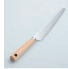
PP-539 ケーキ・パン切りナイフ Cake/Bread Knife

■材質 刃:ステンレス刃物鋼、口金:ステンレススチール、ハンドル:天然木にウレタン塗装 ■サイズ(mm) 約298×33×23、 刃渡り:約160 ■重さ 約61g