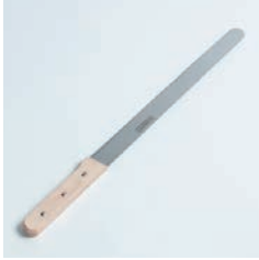
PP-537 ケーキナイフ Cake Knife

■材質 刃:ステンレス刃物鋼、ハンドル:天然木にウレタン塗装 ■サイズ(mm) 約442×31×16、 刃渡り:約300 ■重さ 約133g