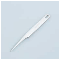
PP-531 タルトヘラ Turt Cutter

■材質 ステンレススチール ■サイズ(mm) 約172×14×5 ■重さ 約23g