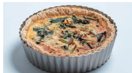
具だくさんのキッシュが焼けるタルト型（キッシュ）

切れ味がよく生地を傷めずにカットできるケーキナイフや、高品質な国産の製造技術に裏打ちされた抜き型など、日本製の商品を多数取り揃えています。