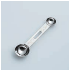
PP-512 計量スプーン Measuring Spoon

■材質 18-8ステンレススチール ■サイズ(mm) 約165×41×18 ■重さ 約53g ■容量 小さじ:約5cc 大さじ:約15cc