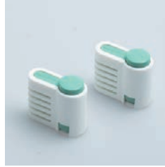
PP-538 スポンジスライサー用 補助具 2 pcs of Cake Knife Adjuster

■材質 本体:ナイロン(耐熱温度150℃)、ばね:ステンレススチール ■サイズ(mm) 約47×53×25 ※1つ分 ■重さ 約32g ※1つ分