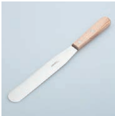
PP-523 パレット (大) 20cm Spatula (L) 20cm Blade

■材質 ヘッド:ステンレススチール、ハンドル:天然木にウレタン塗装 ■サイズ(mm) 約321×31×15 ■重さ 約74g