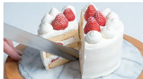
刃物のまち岐阜県関市で作られる切れ味のいいケーキナイフ