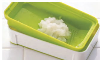
余分な水分がしっかり取れる水切り