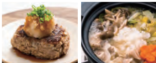
おろしハンバーグ

おろし金は全体的に緩やかなアーチ状のカーブがかかっています。この独自のカーブの「3D おろし金」でおろすことで、大根などの食材の断面が常におろしやすい角度になり、軽い力ですりおろすことができます。