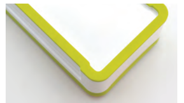
裏面に滑り止め付き