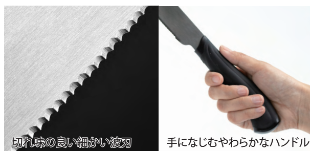
切れ味の良い細かい波刃