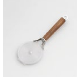
WT-18 ピザカッター Pizza Cutter

■材質 ヘッド:ステン レススチール、口金・ フック・尻金:真鍮にク ロームメッキ、ハンド ル:天然木にウレタン 塗装、カバー:ポリプロ ピレン(耐熱温度90℃) ■サイズ(mm) 約175×66×18、カ バー装着時:約211× 76×18 ■重さ 約62g、カバー装着時: 約76g