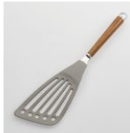
WT-11 ナイロンバタービーター Nylon Beater

■材質 ヘッド:ナイロン(耐熱温度180℃)、シャンク:18-8ステンレススチール、口金・フック・尻金:真鍮にクロロムメッキ、ハンドル:天然木にウレタン塗装 ■サイズ(mm) 約310×80×18 ■重さ 約69g