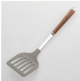
WT-10 ナイロンターナー Nylon Turner

■材質 ヘッド:ナイロン(耐熱温度180℃)、シャンク:18-8ステンレススチール、口金・フック・尻金:真鍮にクロロムメッキ、ハンドル:天然木にウレタン塗装 ■サイズ(mm) 約305×80×45 ■重さ 約65g