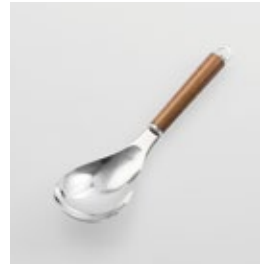
WT-21 サービングスプーン Serving Spoon

■材質 ヘッド:18-8ステン レススチール、口金・フック・ 尻金:真鍮にクローム メッキ、ハンドル:天然 木にウレタン塗装 ■サイズ(mm) 約238×63×40 ■重さ 約105g