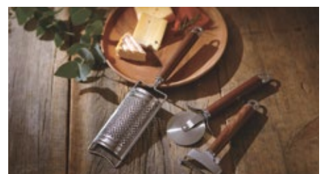
食卓を美しく演出する小物も充実

ウォールナットは割れにくく、非常に加工性の良い木です。表面が特有の艶のある美しい濃い茶色のため、見た目も美しい木材です。耐久性にも優れており、虫の被害も受けにくいと言われています。世界的な銘木で、家具の材料としては特に評価されています。家具材や彫刻、化粧単板としても重宝されています。