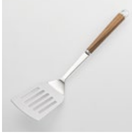
WT-04 ターナー穴あき Slotted Turner

■材質 ヘッド:18-8ステンレススチール、口金・フック・尻金:真鍮にクロロムメッキ、ハンドル:天然木にウレタン塗装 ■サイズ(mm) 約310×70×45 ■重さ 約82g