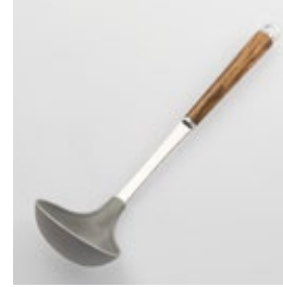
WT-09 ソフトお玉 Polypropylene Ladle

■材質 ヘッド:ポリプロピレン(耐熱温度110℃)、シャンク:18-8ステンレススチール、口金・フック・尻金:真鍮にクロロムメッキ、ハンドル:天然木にウレタン塗装 ■サイズ(mm) 約295×85×63 ■重さ 約65g ■容量 約75cc