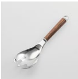
WT-22 サービングフォーク Serving Fork

■材質 ヘッド:18-8ステン レススチール、口金・フック・ 尻金:真鍮にクローム メッキ、ハンドル:天然 木にウレタン塗装 ■サイズ(mm) 約238×63×40 ■重さ 約88g