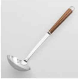
WT-01 お玉 (中) Ladle (M)

■材質 ヘッド:18-8ステンレススチール、口金・フック・尻金:真鍮にクロロムメッキ、ハンドル:天然木にウレタン塗装 ■サイズ(mm) 約295×80×68 ■重さ 約96g ■容量 約70cc