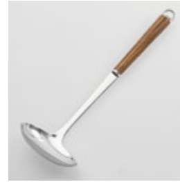
WT-03 横レードル Gravy Ladle

■材質 ヘッド:18-8ステンレススチール、口金・フック・尻金:真鍮にクロロムメッキ、ハンドル:天然木にウレタン塗装 ■サイズ(mm) 約290×90×57 ■重さ 約84g ■容量 約50cc