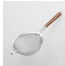
WT-15 万能こし Strainer

■材質 ヘッド:18-8ステンレススチール、口金・フック・尻金:真鍮にクロロムメッキ、ハンドル:天然木にウレタン塗装 ■サイズ(mm) 約325×140×60 ■重さ 約110g