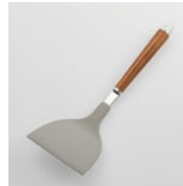
WT-12 ナイロン起し返し Nylon Small Turner

■材質 ヘッド:ナイロン(耐熱温度180℃)、シャンク:18-8ステンレススチール、口金・フック・尻金:真鍮にクロロムメッキ、ハンドル:天然木にウレタン塗装 ■サイズ(mm) 約250×90×48 ■重さ 約64g