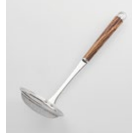
WT-06 かす揚げ Scum Strainer (Regular Mesh)

■材質 ヘッド:18-8ステンレススチール、口金・フック・尻金:真鍮にクロロムメッキ、ハンドル:天然木にウレタン塗装 ■サイズ(mm) 約280×90×80 ■重さ 約82g