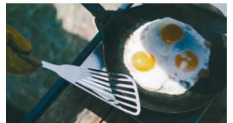
鉄フライパンで使えるステンレススチール製のヘッド