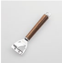
WT-19 栓抜缶切 Bottle & Can Opener

■材質 缶切刃:炭素鋼にク ロームメッキ、栓抜部: ステンレススチール、 口金・フック・尻金:真 鍮にクロームメッキ、 ハンドル:天然木にウ レタン塗装 ■サイズ(mm) 約160×42×18 ■重さ 約54g