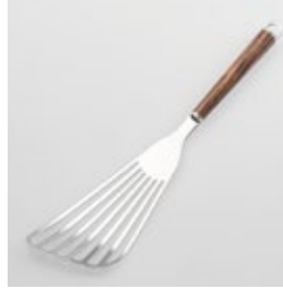
WT-05 バタービーター Beater

■材質 ヘッド:18-8ステンレススチール、口金・フック・尻金:真鍮にクロロムメッキ、ハンドル:天然木にウレタン塗装 ■サイズ(mm) 約315×80×18 ■重さ 約77g