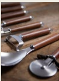
天然木のハンドルなので色調や木目の違いがあります