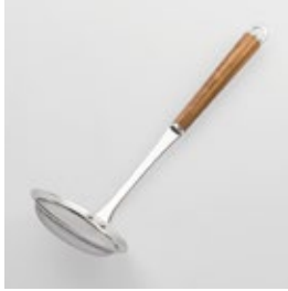
WT-07 あく取り Scum Strainer (Fine Mesh)

■材質 ヘッド:18-8ステンレススチール、口金・フック・尻金:真鍮にクロロムメッキ、ハンドル:天然木にウレタン塗装 ■サイズ(mm) 約280×90×80 ■重さ 約75g