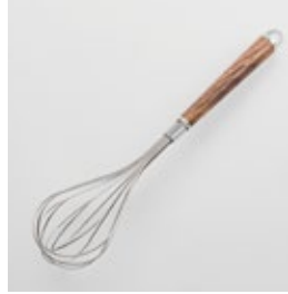
WT-08 泡立て Whisk

■材質 ヘッド:ステンレススチール、口金・フック・尻金:真鍮にクロロムメッキ、ハンドル:天然木にウレタン塗装 ■サイズ(mm) 約290×70×70 ■重さ 約57g