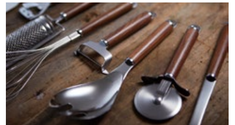
ツールのヘッドは継ぎ目のない高級仕様

天然木の優しい質感とステンレスの輝きがインテリアとしての存在感を放ち、キッチンに高級感をプラスします。基本のツールに加え、サービングウェアも充実。キッチンだけでなく、ダイニングなどの食卓シーンを美しく演出します。