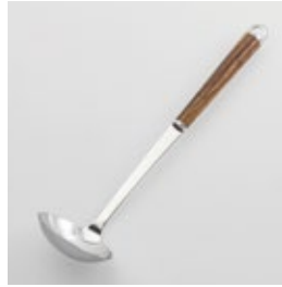
WT-02 お玉 (小) Ladle (S)

■材質 ヘッド:18-8ステンレススチール、口金・フック・尻金:真鍮にクロロムメッキ、ハンドル:天然木にウレタン塗装 ■サイズ(mm) 約285×70×63 ■重さ 約84g ■容量 約40cc