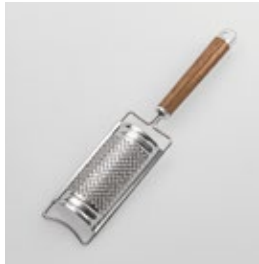
WT-20 チーズおろし Cheese Grater

■材質 ヘッド:ステンレス スチール、口金・フック・ 尻金:真鍮にクローム メッキ、ハンドル:天然 木にウレタン塗装 ■サイズ(mm) 約255×54×20 ■重さ 約70g