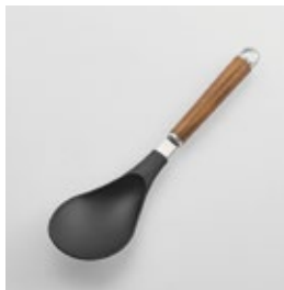
WT-23 ナイロンライススプーン Nylon Rice Spoon

■材質 ヘッド:ナイロン(耐熱 温度180℃)、シャンク: ステンレススチール、 口金・フック・尻金:真 鍮にクロームメッキ、 ハンドル:天然木にウレ タン塗装 ■サイズ(mm) 約257×63×40 ■重さ 約54g