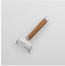
WT-16 ピーラー Peeler

■材質 刃:ステンレス刃物鋼、 フレーム:ステンレス スチール、口金・フック・ 尻金:真鍮にクローム メッキ、ハンドル:天然 木にウレタン塗装 ■サイズ(mm) 約140×70×22 ■重さ 約45g