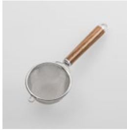
WT-17 茶こし Tea Strainer

■材質 ヘッド:18-8ステンレス スチール、口金・フック・ 尻金:真鍮にクローム メッキ、ハンドル:天然 木にウレタン塗装 ■サイズ(mm) 約205×80×38 ■重さ 約49g