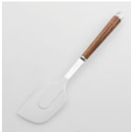
WT-13 ソフトヘラ Silicone Spatula

■材質 ヘッド:シリコーンゴム(耐熱温度220℃)、シャンク:ステンレススチール、口金・フック・尻金:真鍮にクロロムメッキ、ハンドル:天然木にウレタン塗装 ■サイズ(mm) 約280×57×18 ■重さ 約73g